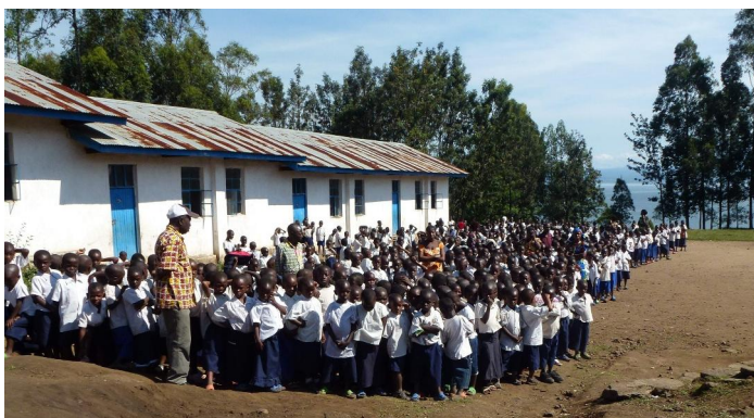
L'Ecole de Minova

Après une assez longue maturation et pas mal d'échanges de mails avec l'inspecteur principal à Butembo, le projet a pris forme. Le voici. Pour cette première année de la mission, nous partons pour deux semaines, au mois de mai, pendant la période scolaire. Les activités concernent des classes de cinquième et sixième primaires. Les cours se dérouleront normalement le matin. Les après-midi auront lieu des ateliers de réflexion sur ce qui a été fait le matin autour du jardin scolaire, "in door" et "out door" ; on entamera également la création d'outils didactiques adaptés à l'exploitation pédagogique du jardin.