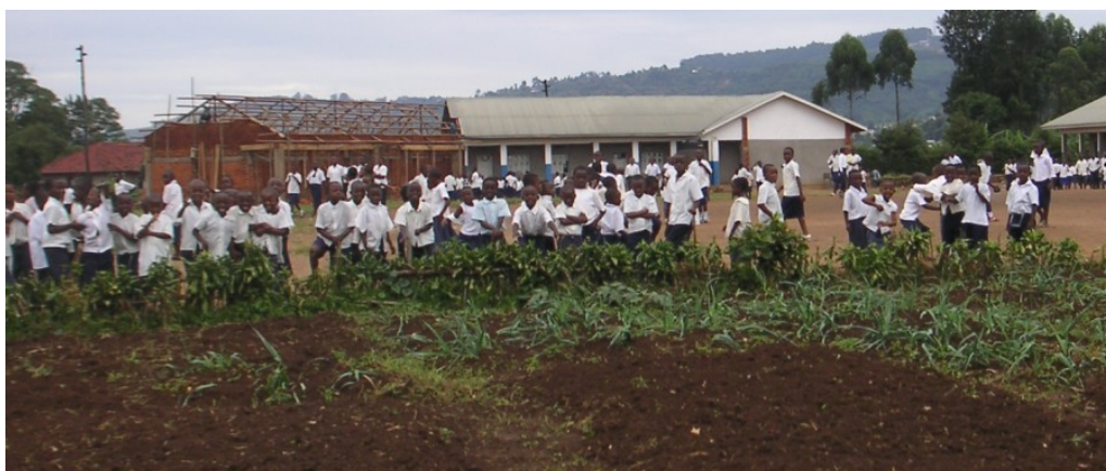
Butembo, mai 2012

Ici aussi, rendez-vous dans notre numéro de décembre !